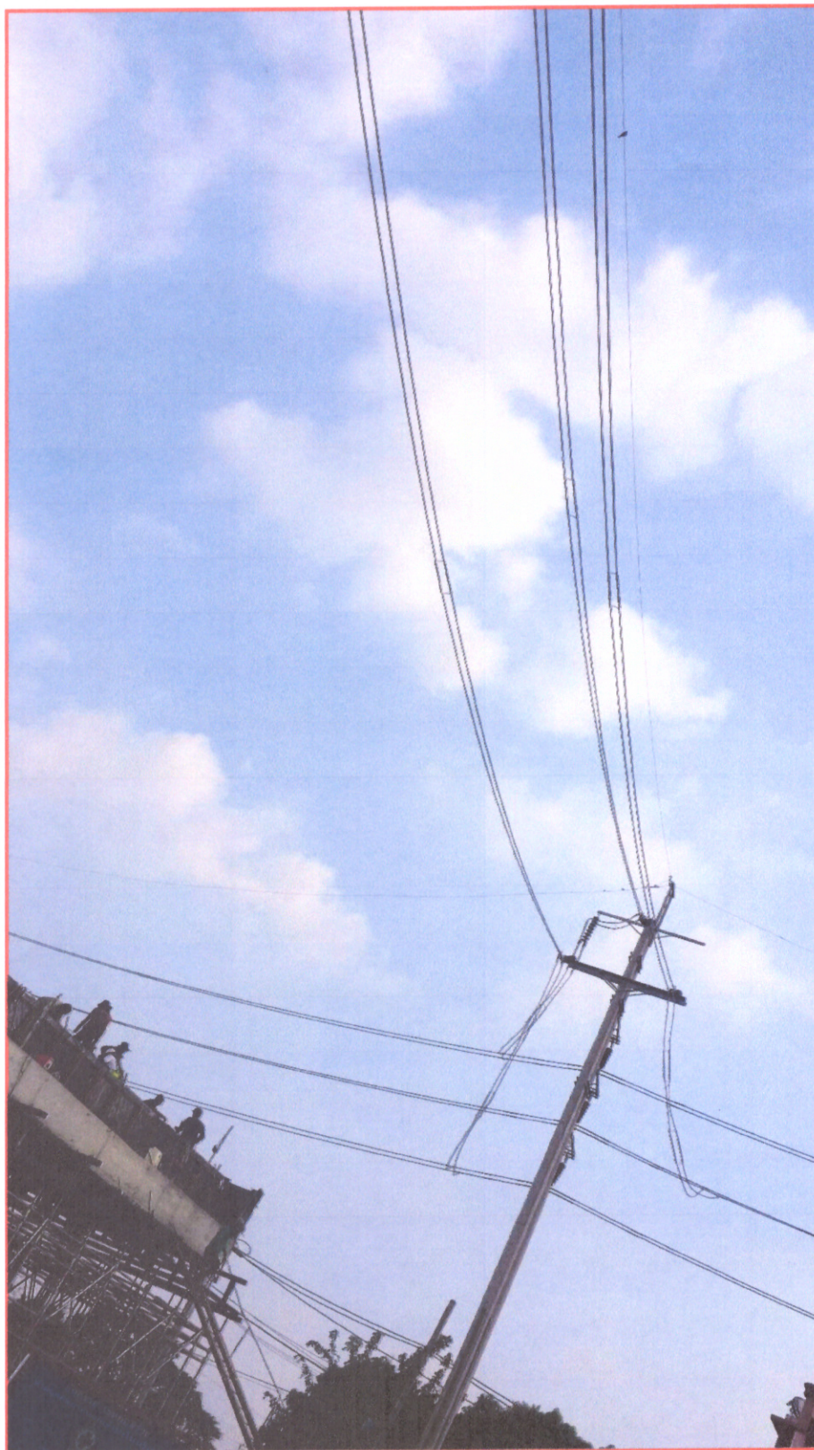
รูปภาพตำแหน่งที่ติดตั้งการยกคานสะพาน